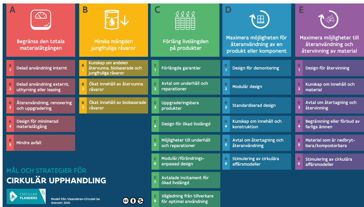
Figur 3. Modellen Mål och strategier för cirkulär upphandling.

Modellen ”Mål och strategier för en cirkulär upphandling” (figur 3) visar olika möjligheter att använda offentlig upphandling som ett strategiskt verktyg för att driva utvecklingen mot en cirkulär ekonomi. Utöver det som tas upp i tabellen är kontinuerliga leverantörssdialoger och uppföljning av ställda avtalskrav viktiga verktyg för att driva förändring genom upphandlingsprocessen.