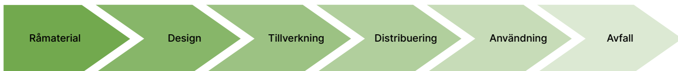
Figur 1. Illustration över den idag dominerande linjära konsumtionsmodellen, där resurser går från råmaterial till att slutligen bli avfall utan att materialet återvinns.

Genom att övergå till en cirkulär ekonomi finns en stor potential att minska resursanvändningen och därigenom begränsa klimat- och miljöpåverkan. En sådan omställning skulle bidra till att vi kan uppnå våra miljö- och klimatmål och de globala målen i Agenda 2030. EU har därför utarbetat en handlingsplan för den cirkulära ekonomin och Sveriges regering har antagit en nationell strategi för cirkulär ekonomi. Visionen i den nationella strategin lyder: ”Ett samhälle där resurser används effektivt i giftfria cirkulära flöden och ersätter jungfruliga material.”